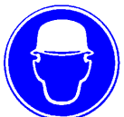
Hełmy ochronne Obowiązkowo