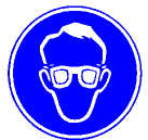
Okulary ochronne Obowiązkowo