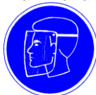
Ochroniacz na twarz Obowiązkowo