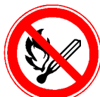
Ogień i palenie